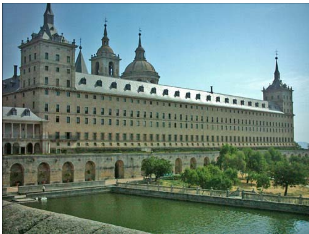
Real sitio de El Monasterio de San Lorenzo de El Escorial