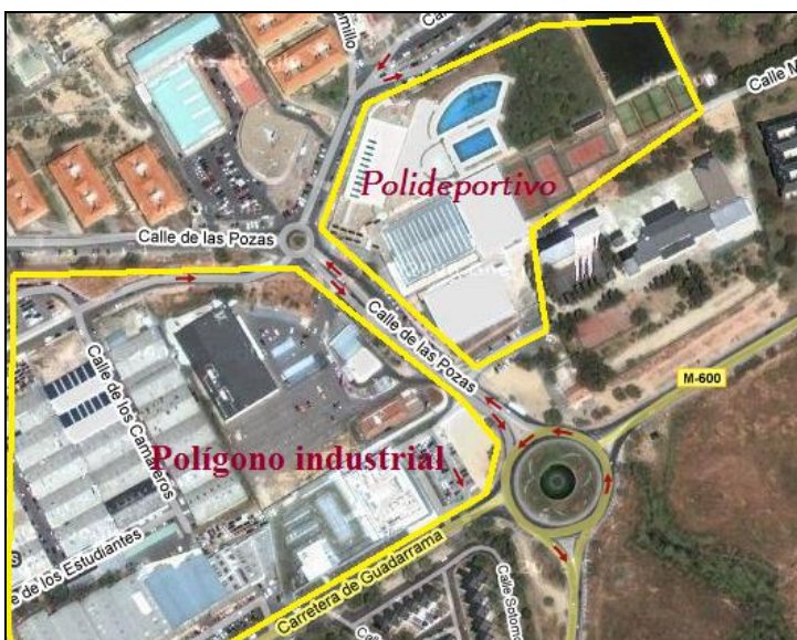
Plano de situación del pabellón

Carretera de Guadarrama s/n, 28200 San Lorenzo de El Escorial