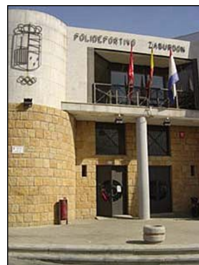
Fachada del pabellón